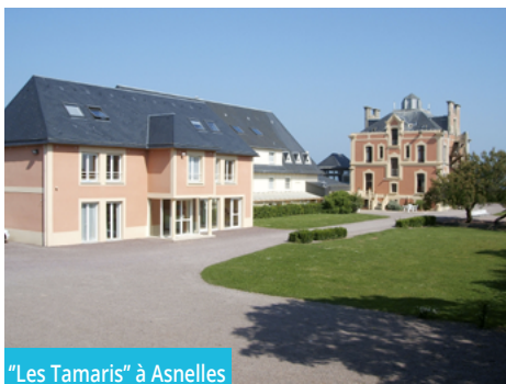
"Les Tamaris" à Asnelles