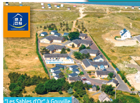
"Les Sables d'Or" à Gouville