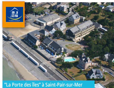
"La Porte des îles" à Saint-Pair-sur-Mer