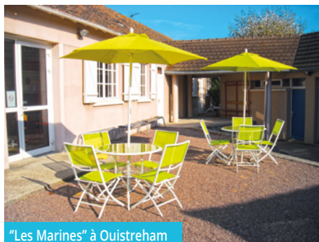
"Les Marines" à Ouistreham